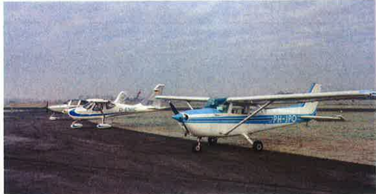
Deel van de vloot van MVVH (vliegclub Hoogeveen) op EDWF.