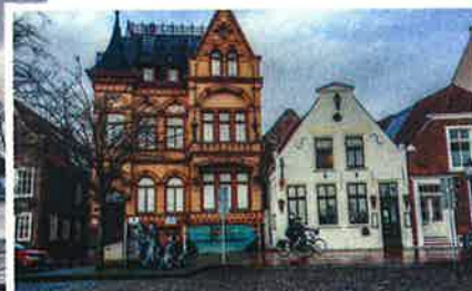
Als je dan toch naar Leer vliegt huur een fiets op het vliegveld en bezoek de stad. Zeer de moeite waard.