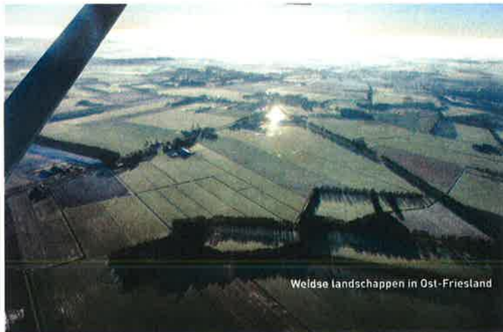
Welde landschappen in Ost-Friesland

Wij vliegen van Hoogeveen (EHHO) naar Leer (EDWF), een afstand van zo'n 55 NM. Een half uurtje vliegen dus. Een mooie trip, je vliegt langs de CTR van Eelde, via Stadskanaal en Papenburg, steekt de rivier